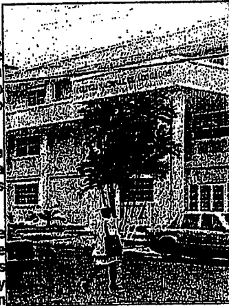
El Colegio de Abogados pide sancionar a los acusados.