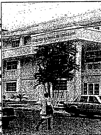
El Colegio de Abogados pide sancionar a los acusados.